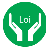
Respect du cadre réglementaire