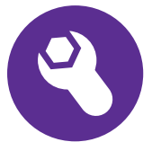
Assistance et Maintenance évolutive