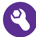
Assistance et Maintenance évolutive